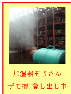
加湿器ぞうさん デモ機 貸し出し中