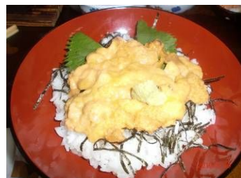
▲ 口の中ですとろけるウニ丼